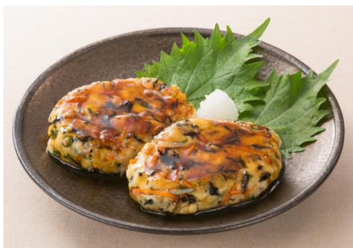
〈アレンジレシピ：ひじきちりめんの豆腐ハンバーグ〉