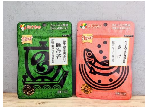
※追加商品 左「磯海苔」、右「さけ」

商品名 ・ のり、たまご ・ わさび ・ 磯一番 ・ 鰹みりん焼 ・ からしめんたい ・ さけ ・ 磯海苔